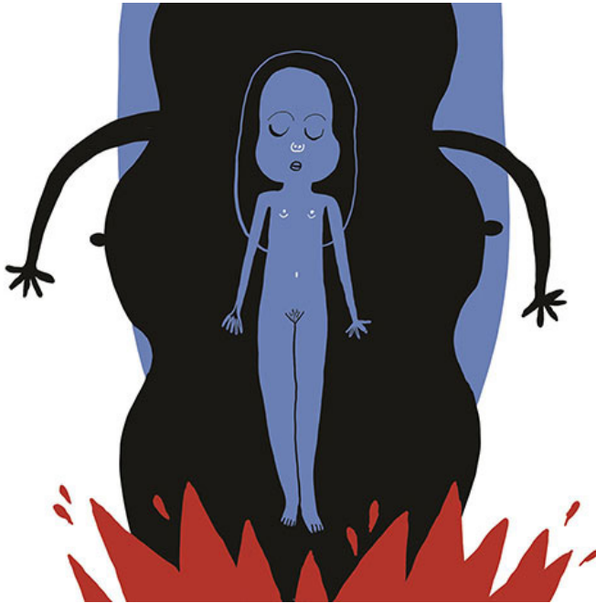
Ill. 2 Ingeborg som jente i en damegryte. Gro Dahle og Kaia Dahle Nyhus. Megzilla . Cappelen Damm, 2015.

pupper som spriker [ill. 2]. Kvinneformens tynne armer og at hun står i et brennende bål, gjør at hun antar form som "den sorte gryte", den mytiske kannibal-gryta som norske barn kjenner fra sanglek. Bålet er rødt og kan også minne om blod. Å bli kvinne innebærer utslettelse av det selvet hun kjenner, noe må uavvendelig dø, og det gjør vondt, akkurat som mensene gjør.